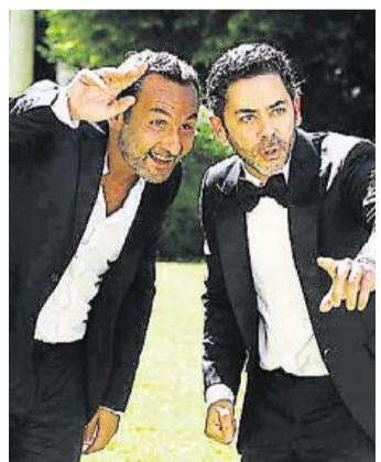
Gilles Lellouche et Manu Payet dans « Sous le même toit », au Mega CGR.