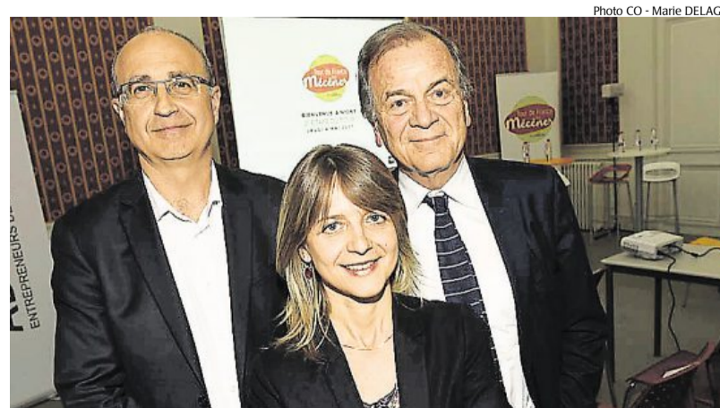
Les responsables de l'Admical à la Chambre de commerce et d'industrie.